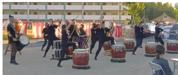
太鼓衆響のみなさん