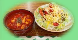
料理教室で作った タコライス