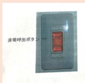
非常呼び出しボタン 緊急時の呼出

※警報音を停止させるには非常呼び出しボタンのカバーを外し、中にある押ボタンを手前に引いて復旧させてください。