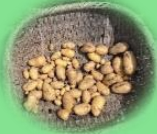
収穫された じゃが芋